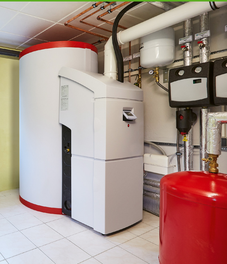
Gasheizungen lassen sich auch mit klimaneutralem Gas betreiben – heute schon mit Bio-Erdgas. Im Bild: eine moderne Gas-Brennwertheizung mit integriertem Warmwasserspeicher für die Solarthermie-Anlage

Auf dem Weg zur Klimaneutralität in Deutschland und Europa wird der Anteil von klimaneutralem Gas in den nächsten Jahren also deutlich zunehmen. Damit leistet die deutsche Gaswirtschaft ihren Beitrag, die Klimaziele einzuhalten. Die Zukunft ist klimaneutral, und das betrifft dann auch das Heizen und viele weitere Gasanwendungen.