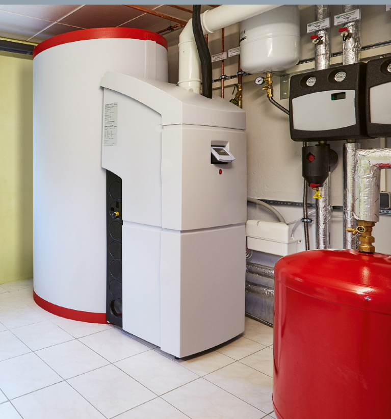
Gasheizungen lassen sich auch mit klimaneutralem Gas betreiben – heute schon mit Bio-Erdgas. Im Bild: eine moderne Gas-Brennwertheizung mit integriertem Warmwasserspeicher für die Solarthermie-Anlage

Wegen dieser positiven Eigenschaften werden fast 50% aller Wohnungen in Deutschland mit Erdgas beheizt.